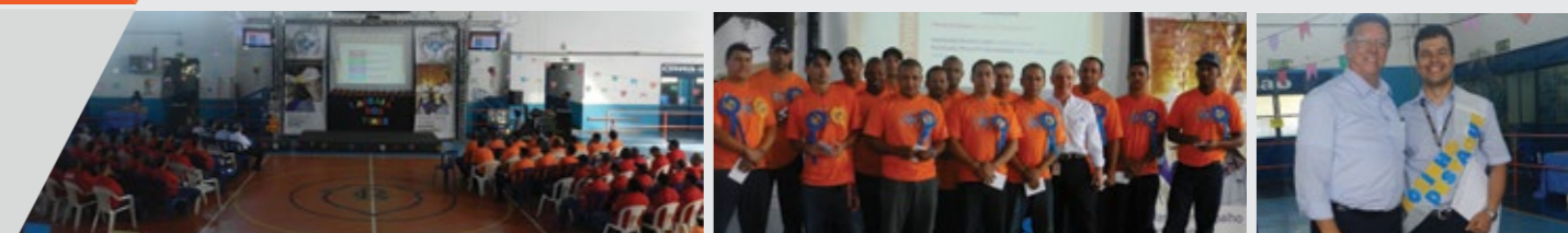
Nas fotos: Arraia dos Times, Time Destaque (Acabamento 12 Choque e Tração Braçadeira) e o "Sinhozinho Destaque"

No dia 18 de julho, foi realizado na AmstedMaxion de Cruzeiro o I Arraia dos Times, 12º Evento de Reconhecimento dos Times. Este evento premiou: os times destaques, o gestor destaque, a equipe suporte destaque e o funcionário que mais teve ideias no Quadro SAT, atingindo assim, suas metas. Parabenizamos a todos os envolvidos e premiados. Confira os melhores momentos do I Arraia dos Times.