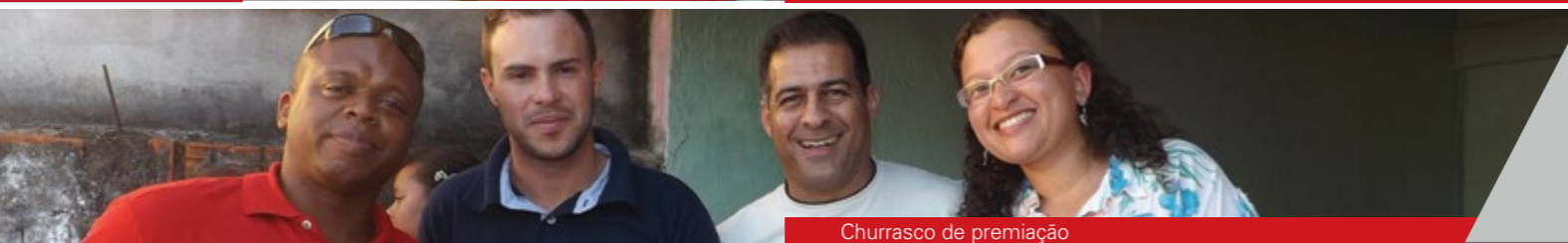
Churrasco de premiação