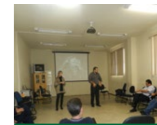
Encontro quinzenal do programa

O Programa de Preparação para o Amanhã – Projeto de vida após a aposentadoria teve início no mês de maio de 2013 e, tem como objetivo proporcionar aos funcionários aposentados ou que estão na fase de pré aposentadoria o entendimento do processo de aposentadoria como uma mudança grande na vida das pessoas e possibilitar uma transição positiva, visando promoção de saúde e qualidade de vida.