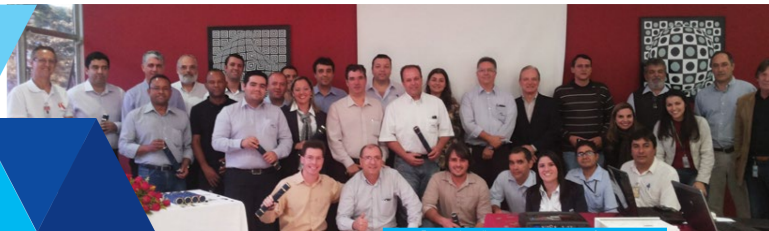
Formandos, diretores, gerentes e professores.