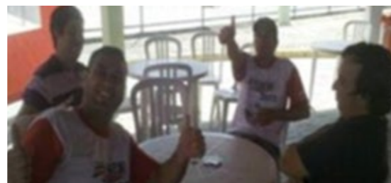
Funcionários de Cruzeiro

Parabéns aos campeões e aos participantes de todas as modalidades.