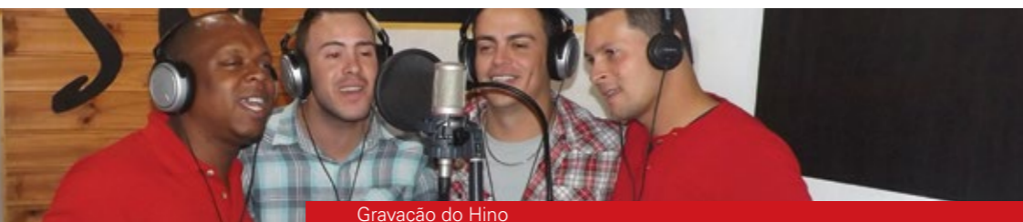
Gravação do Hino

Na última edição do Jornal SaibAMais, divulgamos os momentos do concurso Interação e Arte. No dia 08 de junho, realizamos a gravação do Hino dos Times e também o churrasco de premiação.